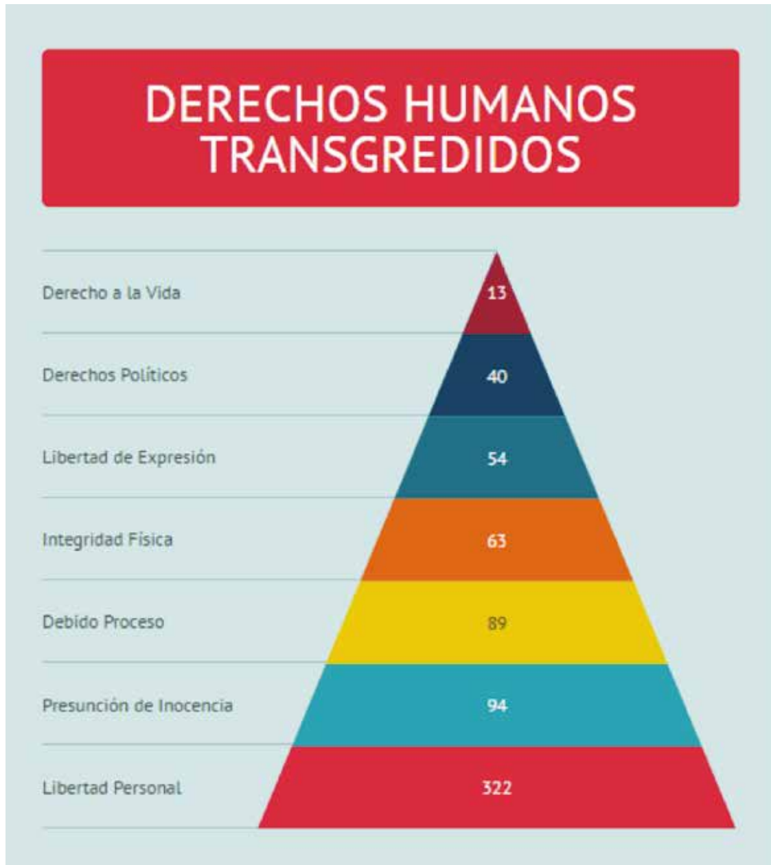
Cuadro N° 11 DERECHOS HUMANOS POLITICOS TRANSGREDIDOS EN EL PERIODO

Durante el año 2016 los derechos humanos más vulnerados en forma descendente fueron los siguientes: derecho a la vida (13 casos), derechos políticos (40 casos), derecho a la libertad de expresión (54 casos), derecho a la integridad física (63 casos), derecho al debido proceso (89 casos), derecho a la presunción de inocencia y finalmente derecho a la libertad personal (322 casos).