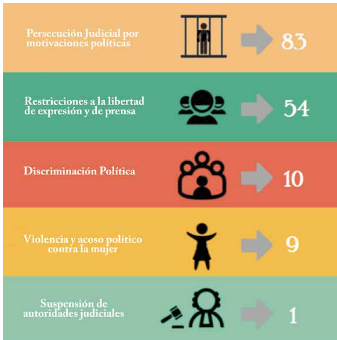
Cuadro N° 10 RESUMEN GENERAL ADAPTADO A LOS EJES TEMATICOS

En el cuadro que antecede, se observan únicamente los casos denunciados sobre violaciones y posibles que violaciones a los Derechos Humanos que se adaptan a 5 de los 6 ejes temáticos de investigación del Observatorio Boliviano de Derechos Humanos , la evidencia muestra que durante el 2016 se han registrado 157 casos , con las siguientes correspondencias; Discriminación Política (10 casos), persecución judicial por motivaciones políticas (83 casos), Restricciones a la Libertad de Expresión y Prensa (54 casos), Violación y Acoso Político Contra la Mujer en Ejercicios de Cargos Electivos (9 casos), y finalmente suspensión de autoridades judiciales sin goce de haberes (1 caso).