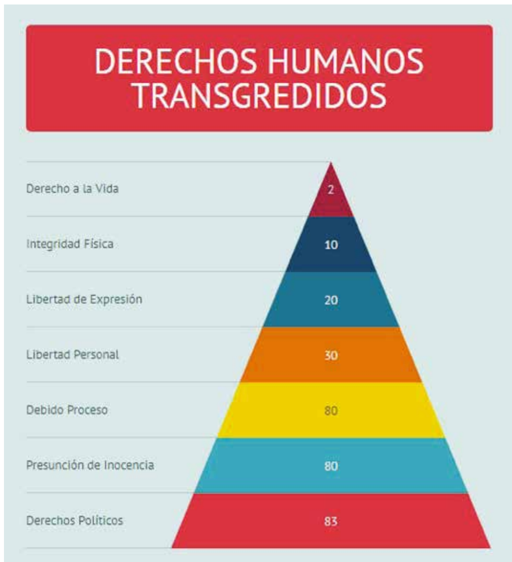
Cuadro N° 9 DERECHOS HUMANOS TRANSGREDIDOS EN EL PERIODO

Durante el primer semestre de 2017, los derechos humanos políticos transgredidos que hemos monitoreado son los siguientes: derechos políticos (83), presunción de inocencia (80), debido proceso (80), libertad personal (30), libertad de expresión (20), integridad física (10), derecho a la vida (2).