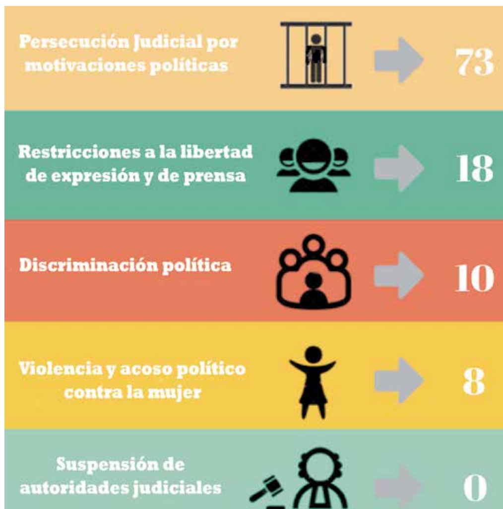
Cuadro N° 8 RESUMEN GENERAL ADAPTADO A LOS EJES TEMATICOS

En el cuadro que antecede, observamos que se han monitoreado un total 109 casos de violaciones a los derechos humanos que encajan dentro de los ejes temáticos que investigamos como Observatorio. De los cuales un 67% (73 casos), corresponden a persecución judicial por motivaciones políticas, restricciones a la libertad de expresión y de prensa 17% (18 casos), discriminación política 9% (10 casos), y violencia y acoso político contra la mujer en el ejercicio de cargos