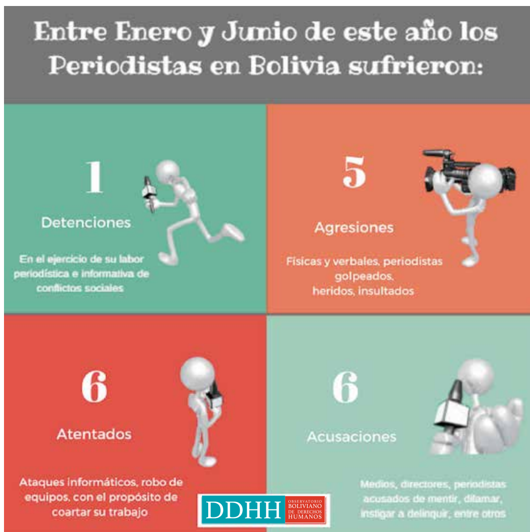
CUADRO N° 4 RESTRICCIONES A LA LIBERTAD DE PRENSA

Cabe destacar que durante todo el 2016, como Observatorio Boliviano de Derechos Humanos , hemos monitoreado 54 casos restricciones a la libertad de expresión y de información, lamentablemente este escenario adverso y deteriorado se ha mantenido durante el primer